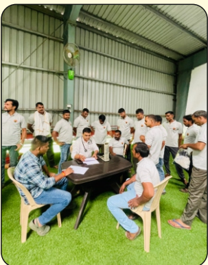
Drivers' Medical Check up and training at MLL-MTBT, Mora Surat