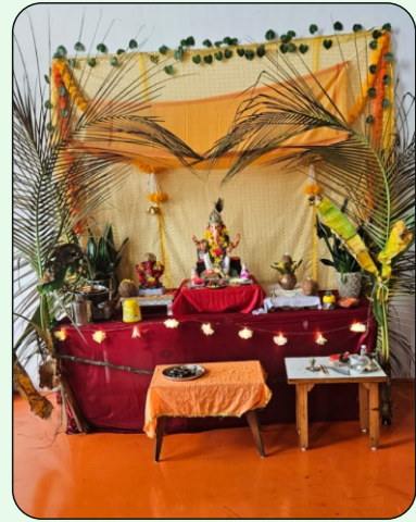
Ganpati Pooja at Vidhik Prints, Chikhli