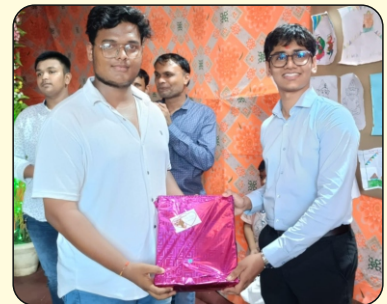
Prize Distribution for Various Competitions Organised during Ganpati Festival at Ambethi Factory, Vapi