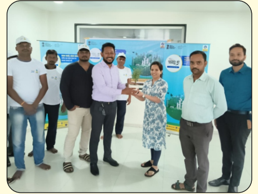
Swachta Pakhwada and Plant Distribution by BPCL at MLL House, Vapi