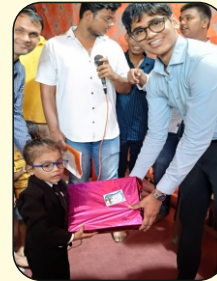
4th Prize Ayush