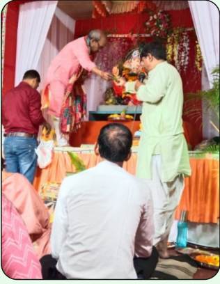
Ganpati Pooja at Ambethi Factory, Vapi