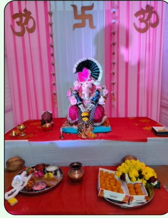
Ganpati Pooja at MLL-MTBT, Mora Surat